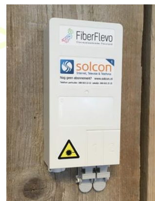
Afbeelding FTU FiberFlevo

Ook na de aansluiting op het glasvezelnetwerk rekenen we op uw medewerking. Als er iets aan de hand is of als u ergens over twijfelt, kan het zijn dat een monteur de netwerkverbinding naar uw pand/woonhuis moet controleren. De kans dat zoiets zich voordoet is overigens niet groot, maar we nemen liever het zekere voor het onzekere. Het spreekt voor zich dat de kabel en de glasaansluiting bereikbaar moeten blijven en bijvoorbeeld niet achter een nieuwe gemetselde muur verdwijnen.